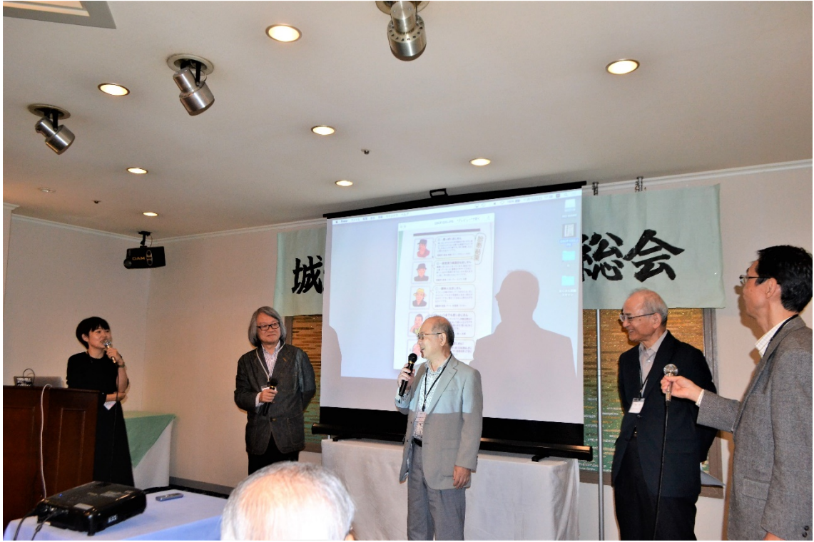
おじさん診断風景