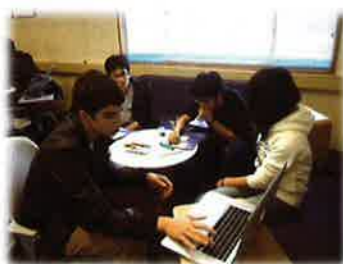
海外研修(アメリカ合衆国)