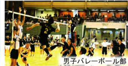
男子バレーボール部

硬式テニス部 学年問わず仲よく楽しく活動中です。公式戦に向けて日々全力で練習しています。経験者はもちろん、初心者も大歓迎です!テニスに少しでも興味があればぜひ入ってください!