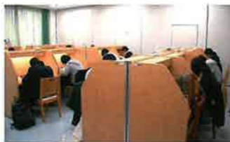
平日は20時まで利用できる自習室