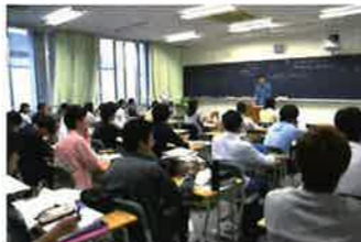
2年・卒業生進路講演会