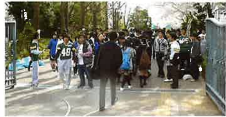
クラブ活動の勧誘