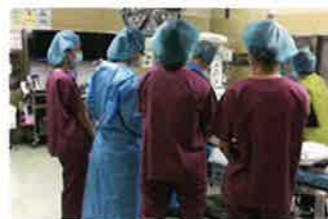
チームメディカルの生徒を対象とした手術室見学会。都立大塚病院にて