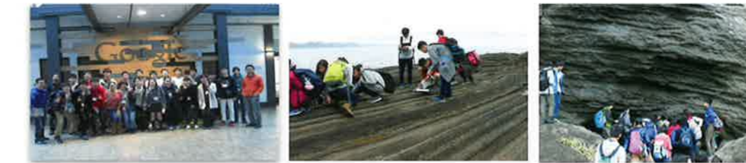
海外研修(SSH) アメリカでの海外研修。

1年生を対象に2泊3日で行われます。テーマを決めた討論が中心ですが、登山やレクリエーション、奉仕活動など盛り沢山です。