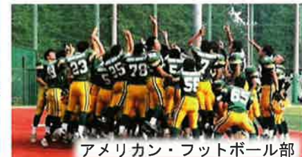
アメリカン・フットボール部