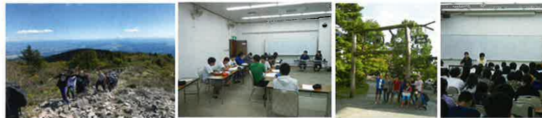
ホームルーム合宿(1年)

9月上旬に行われる最大のイベント。クラス企画は、1年展示、2年演劇、3年映画です。展示は社会問題や学校生活に関する質の高い内容。演劇・映画は生徒自らが脚本・演出を手がけ、若者の心を握り下げたものが多く、感動を呼んでいます。