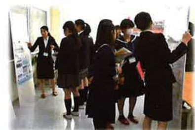
Symposium of Women Researchers