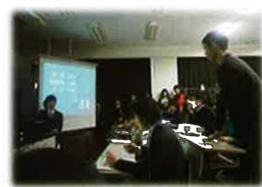
Toyama Science Symposium