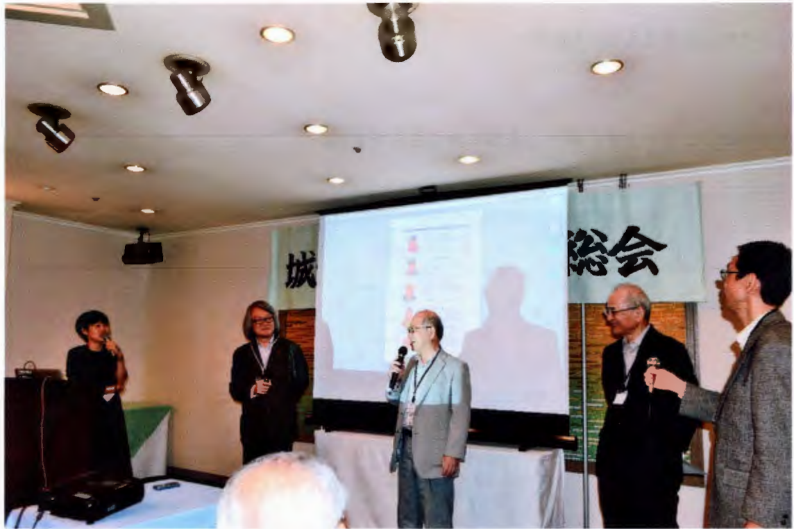
おじさん診断風景