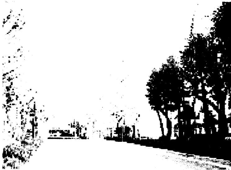
現在の戸山高校